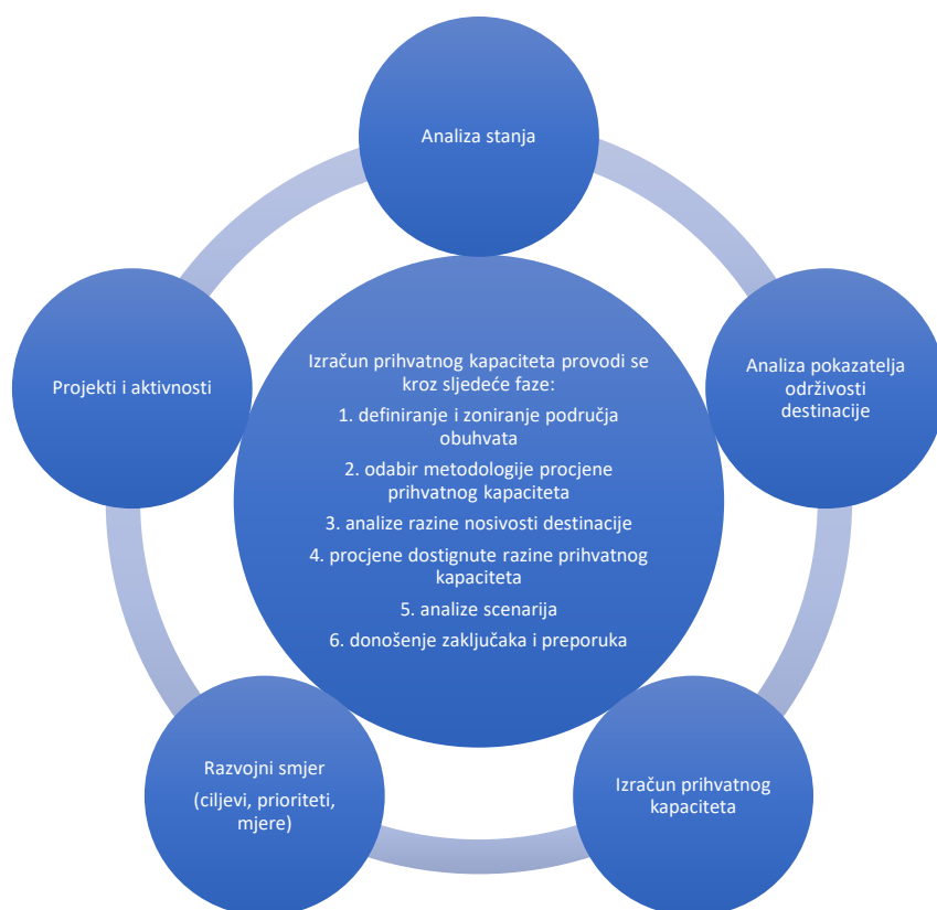
Slika 2. Integriranje izračuna prihvatnog kapaciteta u plan upravljanja destinacijom