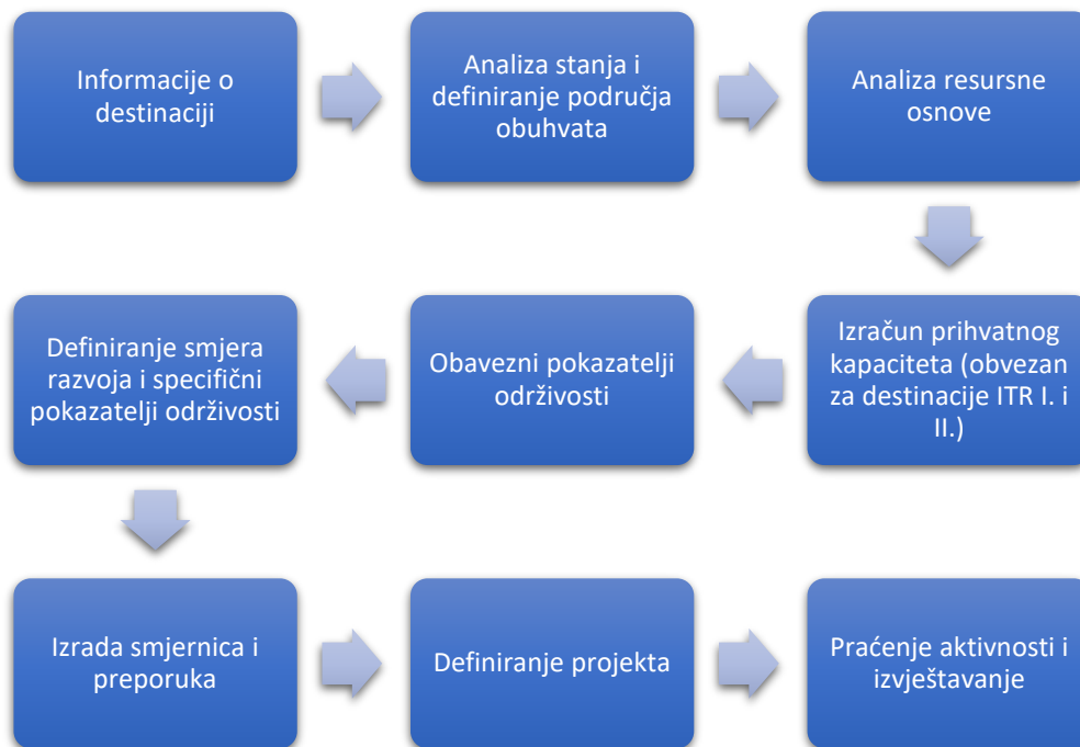
Slika 1. Faze izrade Plana upravljanja destinacijom

Plan upravljanja destinacijom na lokalnoj razini, za turističke zajednice razvrstane u kategoriju I i II indeksa turističke razvijenosti (ITR) mora biti temeljen na izračunu prihvatnih kapaciteta koji se izrađuje u skladu s odredbama Pravilnika o metodologiji izračuna prihvatnog kapaciteta.