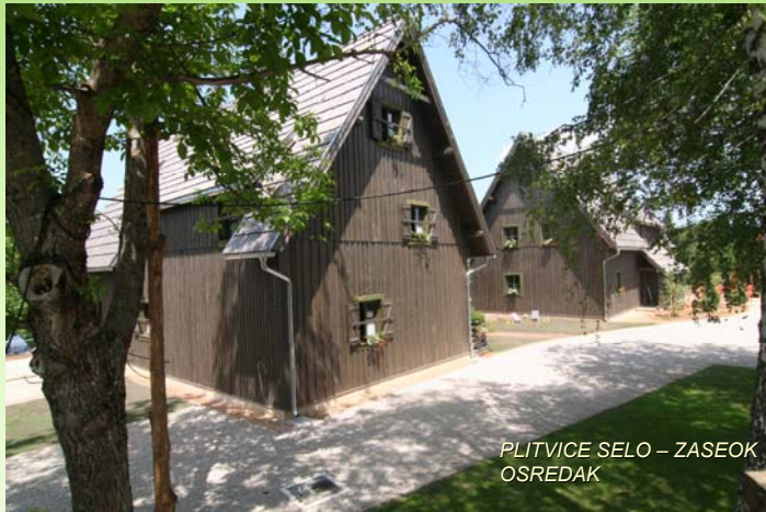
PLITVICE SELO – ZASEOK OSREDAK