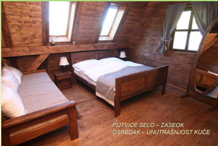
PLITVICE SELO – ZASEOK OSREDAK – UNUTRAŠNOST KUĆE

Uprava ruralnog razvoja, EU i međunarodne suradnje MINISTARSTVO POLJOPRIVREDE