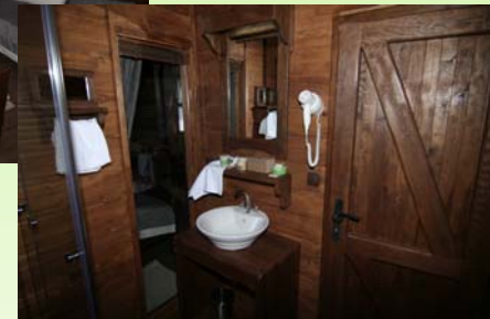
PLITVICE SELO – ZASEOK OSREDAK – UNUTRAŠNOST KUĆE