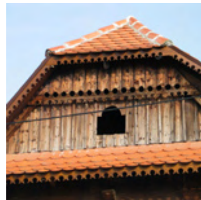
Zadržani i obnovljeni uresi na krovnim letvama zabatnog trapeza i podrožnice zabatnog krova