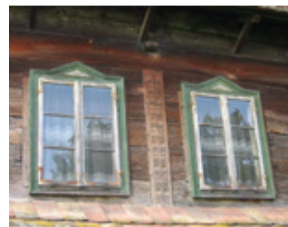
Postojeći prozori na glavnom (uličnom) pročelju kuće