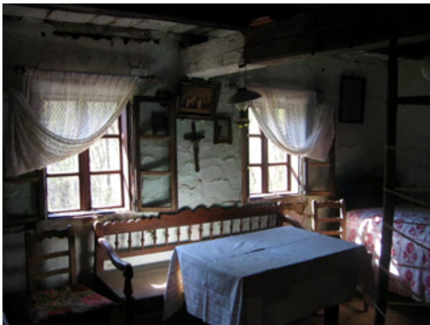
Tradicijski prostor družinske hiže

Pri adaptaciji svake tradicijske kuće bit će potrebno izvesti odgovarajući sanitarni čvor (zahod i kupaonicu), uvesti vodovodne instalacije i kanalizaciju, elektroinstalacije i grijanje.