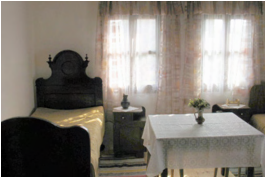
„Prva iža“ u suvremenoj uporabi

najučinkovitiji i najjeftiniji način. Lošija osoba gradnje drvetom jest njegova sklonost izvijanju, “vintanju”, a drvo katkad zaškripi jer “radi”. No, brižljivim postupanjem pri sanaciji i adaptaciji drvena kuća omogućuje najzdravije stanovanje u vlažnim posavskim predjelima.