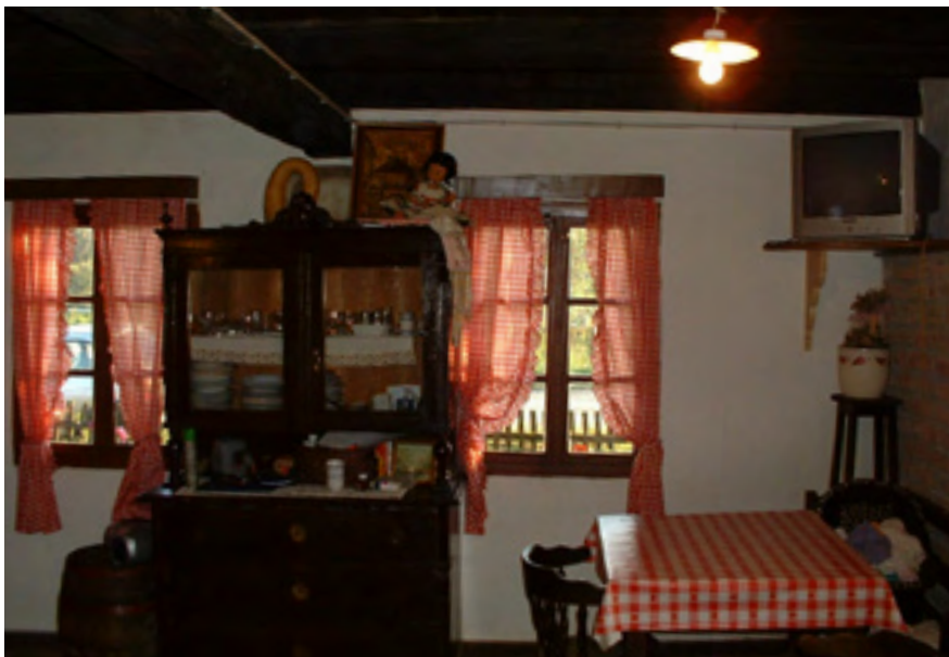
Suvremena upotreba prizemne kuhinje u seoskom turizmu