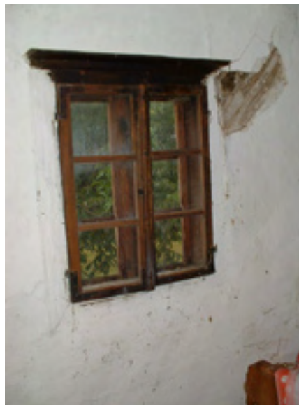
Tradicijski dvokrilni dvostruki prozor (pogled iznutra)

Osnovno načelo i smisao obnove jest očuvanje i zadržavanje svih bitnih tradicijskih značajki, kao što su položaj kuće na okućnici i njezine osnovne oblikovne značajke: visina, vanjski izgled i tradicijski raspored kućnih prostorija, otvoreni ili natkriveni trijem, stubište, karakterističan oblik krovništva, pokrov bibercrijepom, izvorni građevni materijal (drvo, stara opeka), prozore i vrata, potkrovnju oplatu u zabatu izvedenu širokom daskom, te sve