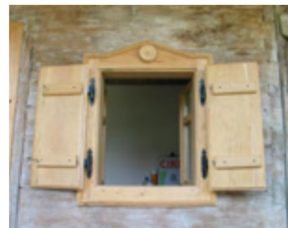
Obnovljeni prozor s kopcima