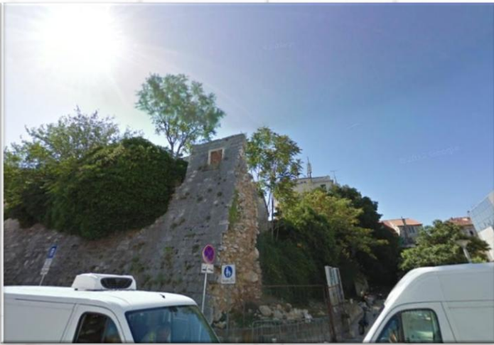
Vojno groblje na početku Marmontove ulice (The cemetery)