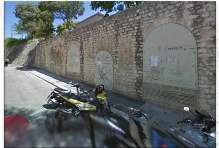
Vrata Cornaro (The Cornaro gate)