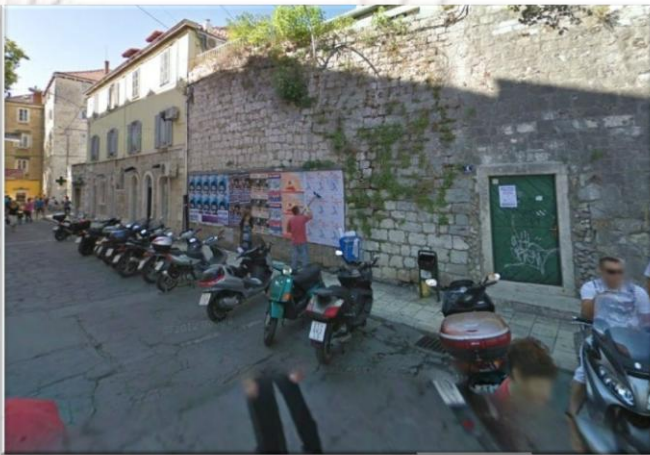
Vrata Priuli (The Priuli gate)